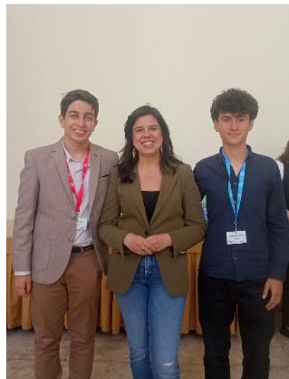
Momento com a deputada Inês Sousa Real

A Exma. Sr. a Presidente da Comissão da Educação e Ciência fez um discurso de encerramento, que mereceu uma salva de palmas. Assim se encerrou a Sessão Nacional do Parlamento dos Jovens - Ensino Básico deste ano. Foi com um sentimento de dever cumprido, de satisfação, mas também com pena que deixámos o Palácio Nacional de São Bento, casa da República e da Democracia portuguesas.