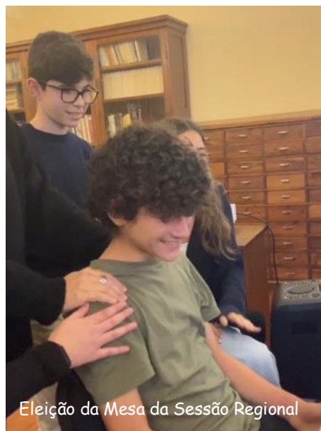
Eleição da Mesa da Sessão Regional

Da eleição da Mesa da Sessão Regional saiu um vice-presidente cheio de satisfação e orgulho, não só por ter sido eleito, mas também pela sua prestação genuína e honesta.