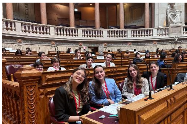
Círculo Eleitoral dos Açores 07/05/24

Às 10:45h, os jovens deputados dirigiram as suas perguntas a cada deputado da Assembleia Nacional ali presente e, ao meio-dia, foi a vez dos jornalistas. Foi uma honra colocar quatro perguntas aos deputados dos partidos IL, BE, PAN, PS, e ouvir a sua visão dos assuntos focados, ao responderem respondeu às questões.