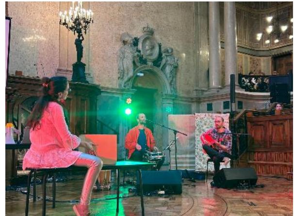
Programa Cultural, Sala do Senado, 06/05/24

No fim do dia, tivemos um evento cultural e, de seguida, o jantar foi proporcionado pela Assembleia e fomos conduzidos de autocarro para o hotel.