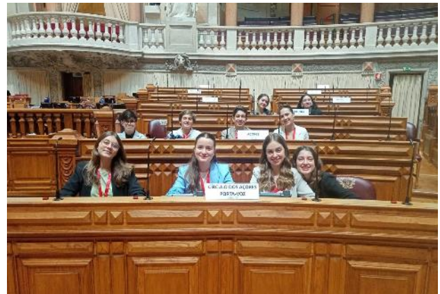
Círculo Eleitoral dos Açores na Sala das Sessões

Depois de uma noite de descanso, e de tomar um pequeno-almoço delicioso, voltamos a dirigir-nos ao Palácio de São Bento. Num instante estávamos lá e o tempo passava mais rápido do que poderíamos imaginar.