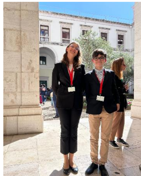
Deputados da ESAQ - CEA, 06/05/24

ficamos a saber (já que não tivemos a oportunidade de ver) que o projeto do Círculo Eleitoral dos Açores ficara em segundo, com 17 votos, o que, apesar de ter deixado um sabor amargo, é um grande feito para nós. E, em democracia, é assim.