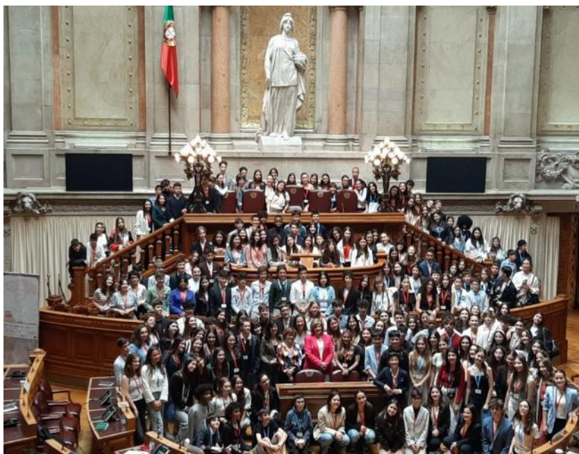
Foto de grupo

A Exma. Sr. a Presidente da Comissão da Educação e Ciência fez um discurso de encerramento, que mereceu uma salva de palmas. Assim se encerrou a Sessão Nacional do Parlamento dos Jovens - Ensino Básico deste ano. Foi com um sentimento de dever cumprido, de satisfação, mas também com pena que deixámos o Palácio Nacional de São Bento, casa da República e da Democracia portuguesas.