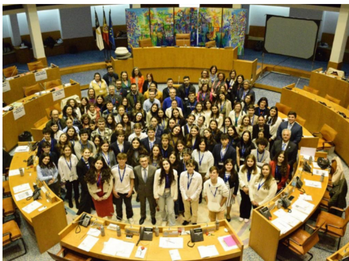
Sessão Regional - Foto de grupo