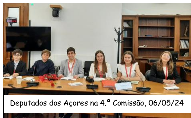
Deputados dos Açores na 4.ª Comissão, 06/05/24