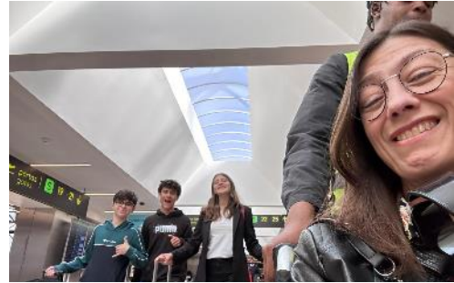
Chegada a Lisboa, 06/05/24

De seguida, e depois de fazer todos os preparativos necessários, lá fomos em direção à Assembleia.