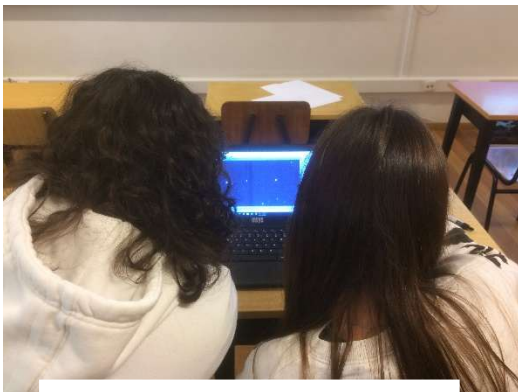
Alunos do 7º A pesquisando asteroides.

Os alunos participantes (da turma A do 7º ano) analisaram, em várias aulas de Ciências Físico-Químicas, imagens disponibilizadas pelo IASC, recorrendo ao software Astrométrica.