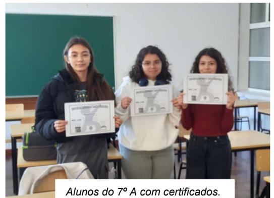
Alunos do 7º A com certificados.