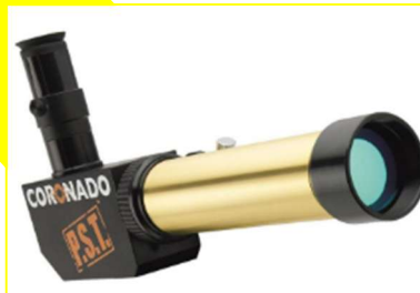
Meade / Coronado 40mm f/10 PST H-Alpha Personal Solar Telescope

Fotografias obtidas com o recurso a um telemóvel Samsung Galaxy A40.