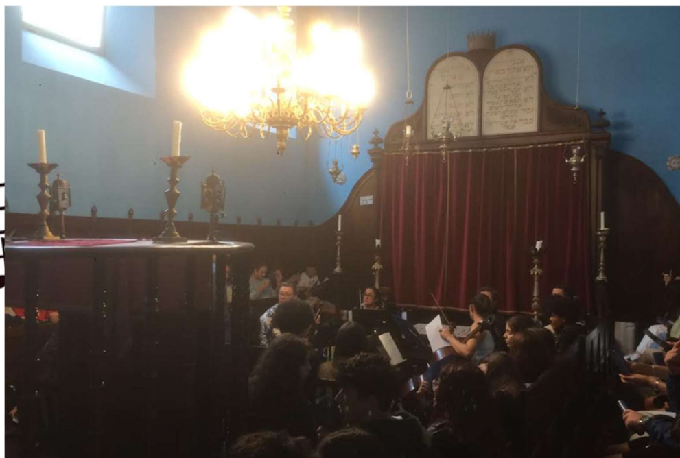
Museu Hebraico Sahar Hassamaim – Portas do Céu – O Concerto

Um agradecimento à Organização e em particular ao Quarteto de cordas “Com.Mozart”.