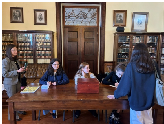
Dia das eleições para a Sessão Escolar

Após um período de campanha feita sala a sala, no dia 15 de janeiro, realizaram-se as eleições para o Parlamento dos Jovens na Escola Secundária Antero de Quental. A Mesa de Voto empenhou-se, garantindo que tudo corria bem. Os alunos do básico que perceberam a importância do ato eleitoral não deixaram de exercer o seu direito. A única lista concorrente, a Lista E/€, formada por alunos dos 7.º e 8.º anos, obteve 130 votos.