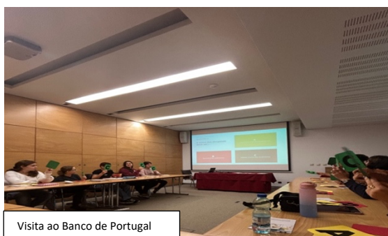
Visita ao Banco de Portugal