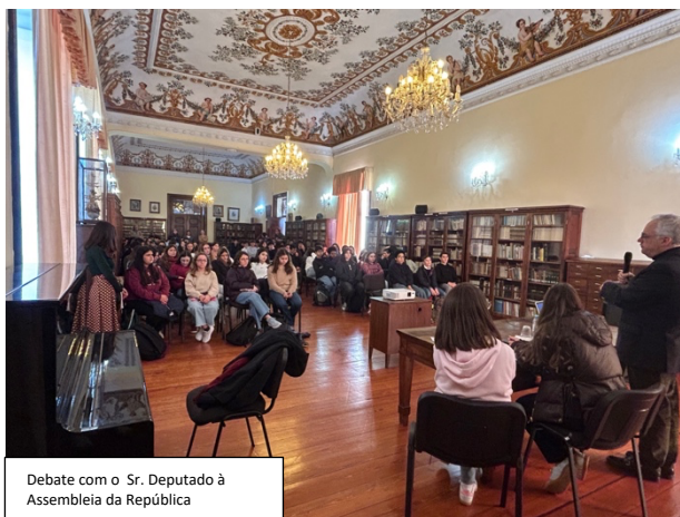
Debate com o Sr. Deputado à Assembleia da República

Ainda nesta 1. a fase, recebemos na nossa escola o Exmo. Sr. Eng. Paulo Moniz, deputado eleito pelo círculo eleitoral dos Açores na Assembleia da República. Nesta sessão, realizada no dia 12 de janeiro na biblioteca patrimonial, lotada, o sr. Deputado reforçou a grande importância que a Literacia Financeira tem nas nossas vidas. No final da sessão, foram feitas perguntas muito pertinentes a que o sr. Deputado respondeu de forma esclarecedora.