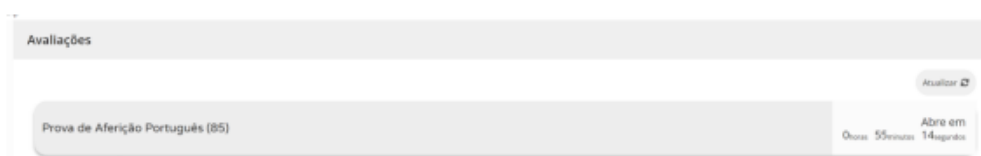
Figura 2 – Acesso à prova a realizar

Nas restantes provas ao clicar um “iniciar sessão”, por exemplo, para um aluno que realiza a prova de aferição de Português (85), aparece o seguinte ecrã: