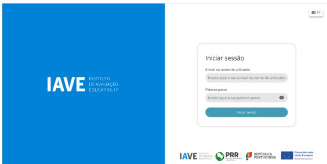
Figura 1 – Acesso à Plataforma de Realização das Provas Eletrónicas do IAVE

Inserir as credenciais “Nome de utilizador” e “Palavra-passe” e, em seguida, clicar em “Aceder” ou “Iniciar sessão”